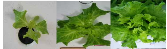
그림 2. 시간에 따른 식물 성장 이미지 데이터

일반적으로 아쿠아포닉스 환경은 고성능의 CPU나 GPU, 대용량의 메모리를 갖추고 있지 않으므로 제한된 환경에서는 연산 과정에서 많은 비용이 소모되는 MAC (Multiply and Accumulation)을 줄이는 Depthwise Separable Convolution을 사용해야 한다.