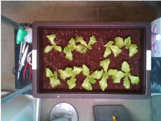
그림 3. 입력된 2D 영상 Figure 3. Input 2D image