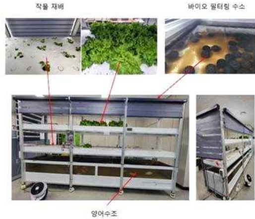
그림 1. 아쿠아포닉스 재배 시스템 Figure 1. Aquaponics Cultivation System

다. 그러나 수경재배의 경우 작물 재배에 필요한 영양분을 양액의 형태인 비료로 제공을 하지만 아쿠아포닉스의 경우 물고기의 배설물과 분비물 등의 유기물과 박테리아 등의 미생물 상호 작용에 의해 식물이 필요한 질산염 등의 영양분이 무기화되어 제공된다.